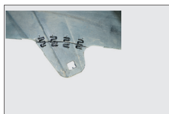
Волнистые скобы с крупной и мелкой змейкой 0.6 мм для ровных поверхностей на тонком пластике.