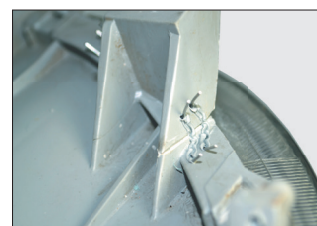
Скобы угловые 0.8 мм для ремонта внутренних и внешних углов крепёжных элементов.