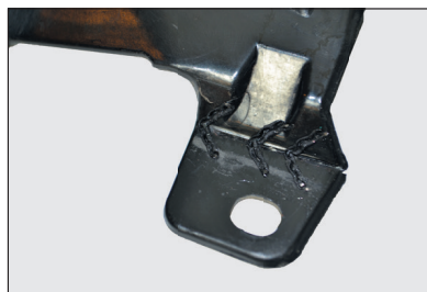
Волнистые скобы с крупной и мелкой змейкой 0.8 мм для ровных поверхностей, подверженных нагрузкам и вибрации.